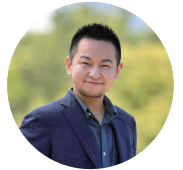
ReBit 代表理事 (社会福祉士・精神保健福祉士)

次の10年は、子ども・若者だけでなく、LGBTQを含むすべての人がありのまま未来を選べる社会を目指して。ReBitはこれからも、少しずつを何度でも、次の「10年後」を創るために、進み続けます。