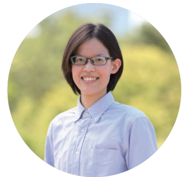
事務局長 (キャリアコンサルタント)

チームとして力が発揮できる土を整えながら、寄附者をはじめとしたReBitを応援して下さる皆さま、学校現場の先生方、企業の担当者さま、行政・連携団体の方々と共に、変革に向けて協働し続けます。